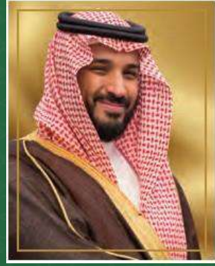
صاحب السمو الملكي الأمير محمد بن سلمان بن عبدالعزيز آل سعود ولي العهد نائب رئيس مجلس الوزراء وزير الدفاع حفظه الله