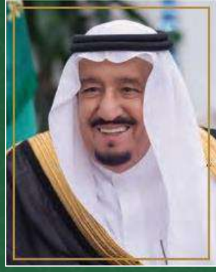
خادم الحرمين الشريفين الملك سلمان بن عبدالعزيز آل سعود حفظه الله