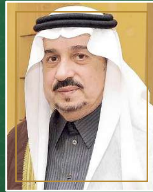
صاحب السمو الملكي الأمير فيصل بن بندر أمير منطقة الرياض رئيس مجلس الإدارة