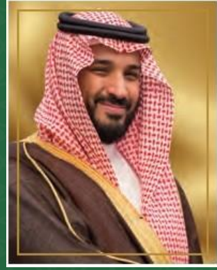
صاحب السمو الملكي الأمير محمد بن سلمان بن عبدالعزيز آل سعود ولي العهد نائب رئيس مجلس الوزراء وزير الدفاع حفظه الله