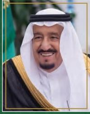
خادم الحرمين الشريفين الملك سلمان بن عبدالعزيز آل سعود حفظه الله