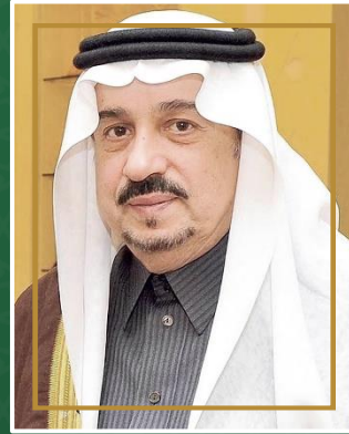
صاحب السمو الملكي الأمير فيصل بن بندر أمير منطقة الرياض رئيس مجلس الإدارة